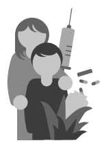
Gesundheit und Betreuung