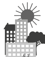
Zukunftsweisendes Wohnen und Arbeiten